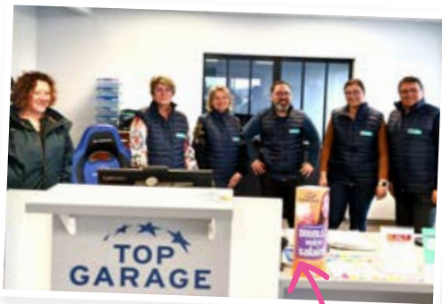
Bolbec Auto Reprise d'activité 6, rue du Val à la Reine