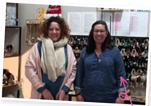
Vos anges gardiens Bijoux / Décoration Déménagement au : 26, place Charles de Gaulle