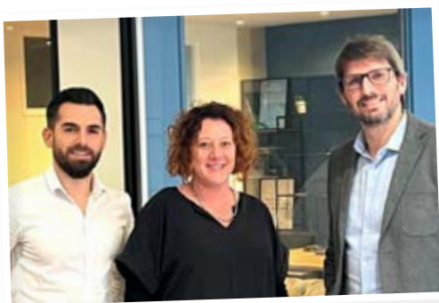
Ymanci Courtier en Immobilier 6, rue Jacques Fauquet