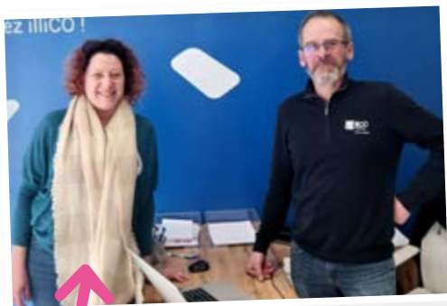
Illico Travaux Accompagnement à la rénovation et aux travaux 14, rue Jacques Fauquet