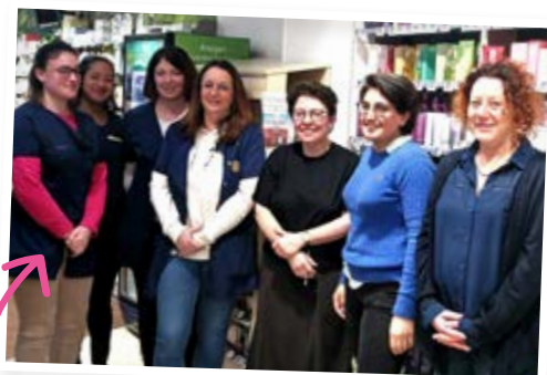
La Pharmacie des Tisserands Reprise d'activité 54, rue de la République