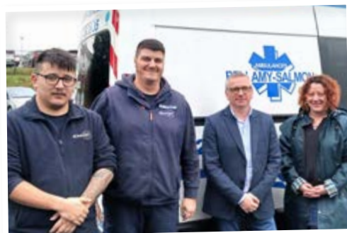
Bellamy Salmon Ambulances Déménagement au : 8, rue du Val à la Reine