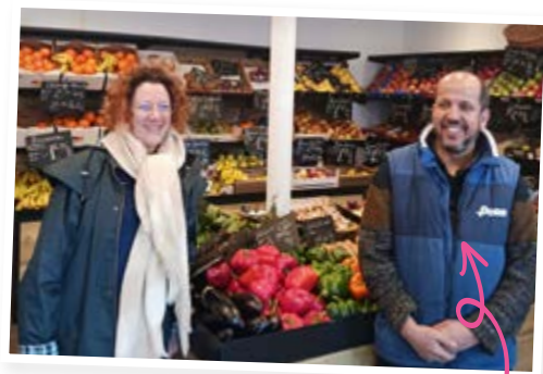
Le Marché de la Place Primeur 7, place Léon Desgenétais